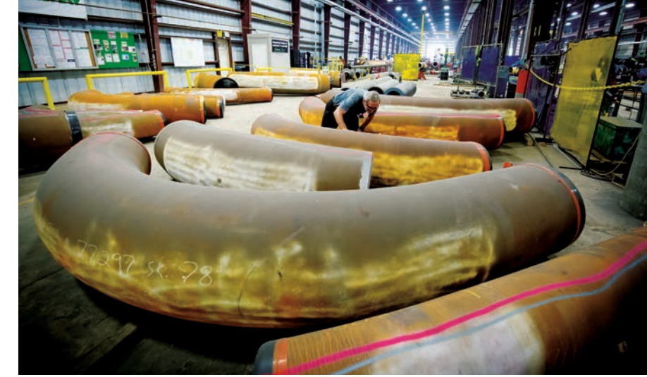
Cada empleado de Zachry tiene un papel en el apoyo a las necesidades esenciales de la sociedad.