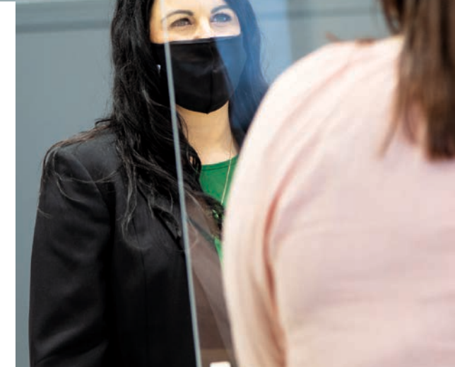
Juntos, hemos continuado trabajando de manera segura a través del cuidado que nos tenemos los unos a los otros.