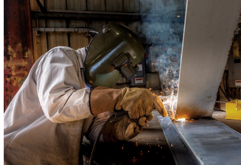
Arriba, derecha: Los empleados de Zachry miran consistentemente más allá del horizonte, desempeñando trabajo que resiste la prueba del tiempo.