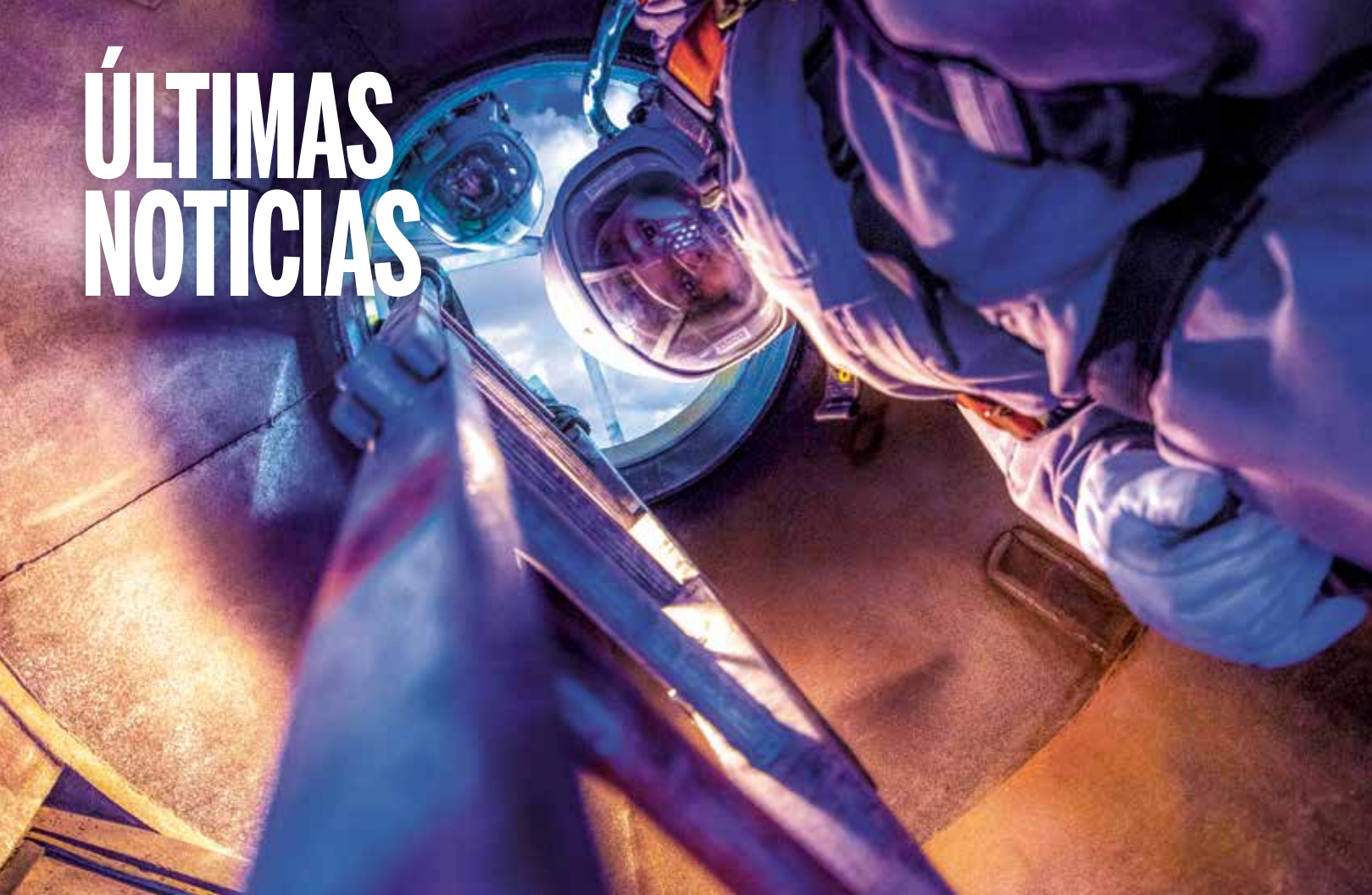
Dos empleados de Servicios de Catalizador en acción.