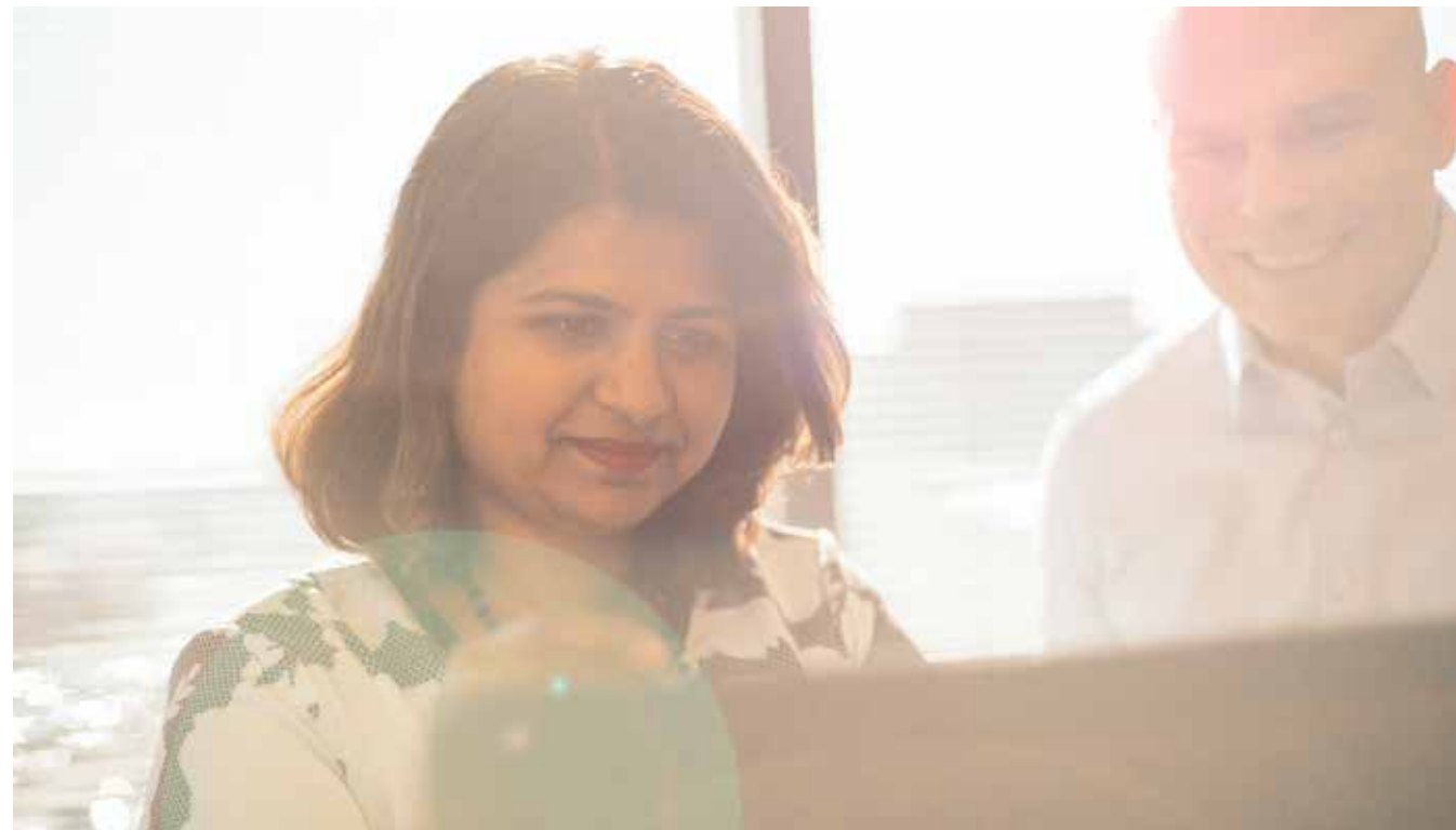
Abajo: Sunali K. , ingeniera superior, y Mark R. , ingeniero IV, examinan los detalles del diseño.

La próxima vez que compre alimentos, recoja medicamentos o planee algunas mejoras en su hogar, es probable que su prioridad sea simplemente terminar sus tareas, pero tal vez, si le da un segundo vistazo a todas las cosas que lo ayudan a cumplirlas, los verá de una manera muy diferente. ■