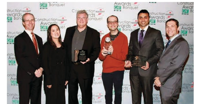
Los representantes de seguridad de Ambitech aceptan sus premios.

La ceremonia de premiación fue una celebración de ir más allá en nombre de la seguridad para la industria de la construcción en el Medio Oeste. Los participantes compartieron las mejores prácticas entre sí, promoviendo la educación de integración de la seguridad con el ahorro de costos y cronograma de trabajo. Los participantes coinciden que las mejores prácticas de seguridad establecidas no solo son lo correcto para las personas, sino que también fortalecen a la economía regional. Sin embargo, a pesar de su éxito, cada asistente se compromete con la mejora continua, ansioso por compartir nuevos éxitos el año entrante. ■